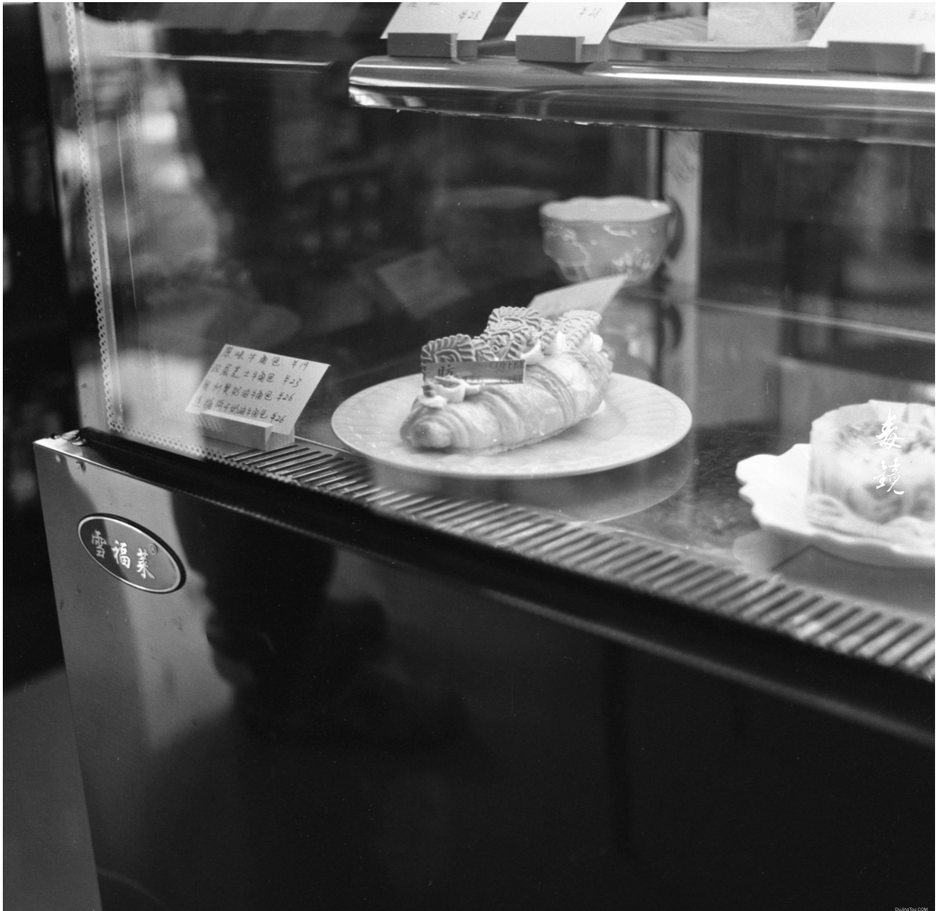
对比两张1023乐凯航空胶片的样片